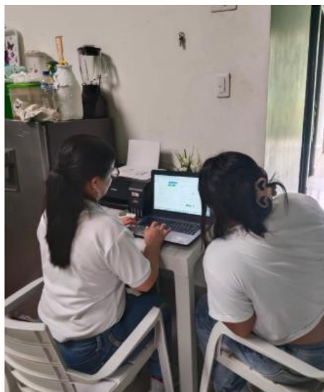
Ilustración 1. Revisión, recepción de los documentos de la población local, para los programas próximos a iniciar formación, 14 de julio de 2025.