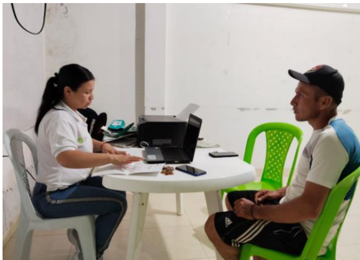
Ilustración 1. Revisión, recepción de los documentos de la población local, para los programas próximos a iniciar formación, 13 de julio de 2025.