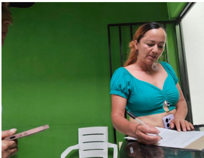
Ilustración 1. Revisión, recepción de los documentos de la población local, para los programas próximos a iniciar formación, 21 de julio de 2025.